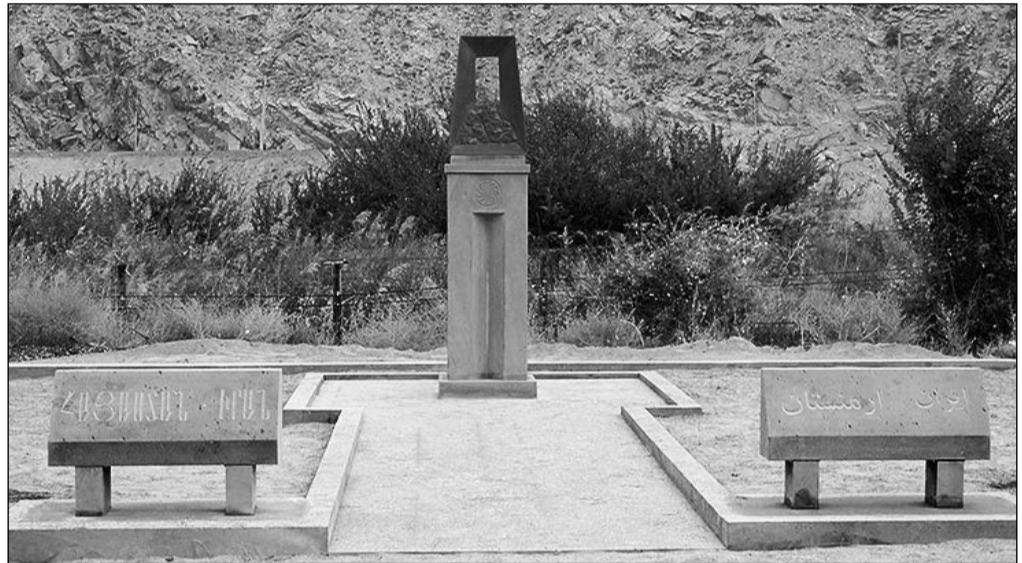
2011 թ. հոկտեմբերի 1-ին Մեղրիում կառուցված՝ հայ-իրանական բարեկամությունը խորհրդանշող հուշարձանը

Սյունիքի արտավայրերի հետ կապված նոր զարգացումներին ծանոթանալու համար բերենք երկու տեղեկատվություն, որ տարածել են «Zham.am»-ը և «econews.am»-ը՝ ապրիլի 25-ին: Առաջին: «Իրանական «Farsnews.am» պարբերականը տեղեկատվություն է տարածել այն մասին, որ Արեւելյան Արդեշան (Ատրպատական) նահանգից արդեն այս տարվա մայիս-հունիս ամիսներին սկսվելու է ոչխարների տեղափոխումը Հայաստանի Սյունիքի մարզ: Արեւելյան Ատրպատական նահանգի ղեկավարն ասել է, որ համաձայնությունը ձեռք է բերվել իր՝ Հայաստան այցելության ժամանակ: Ըստ ձեռք բերված համաձայնության՝ առաջին փուլում՝ 6 ամսվա ընթացքում, Հայաստան կտեղափոխվի 10000 գլուխ ոչխար: 5 տարվա ընթացքում ոչխարների թիվը կհասցվի 50000-ի: Յուրաքանչյուր հոտ ղեկավարելու է 5 հովիվ: Իսկ ՀՀ-ում նրանց կերն ապահովելու է հայկական մի կազմակերպություն: